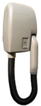
R 810 (s)