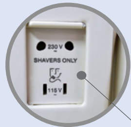
Doppia presa rasoio

Dotato di regolatore di portata aria HIGH - LOW