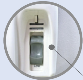
Regolatore di portata aria