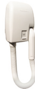
R 810 (w)